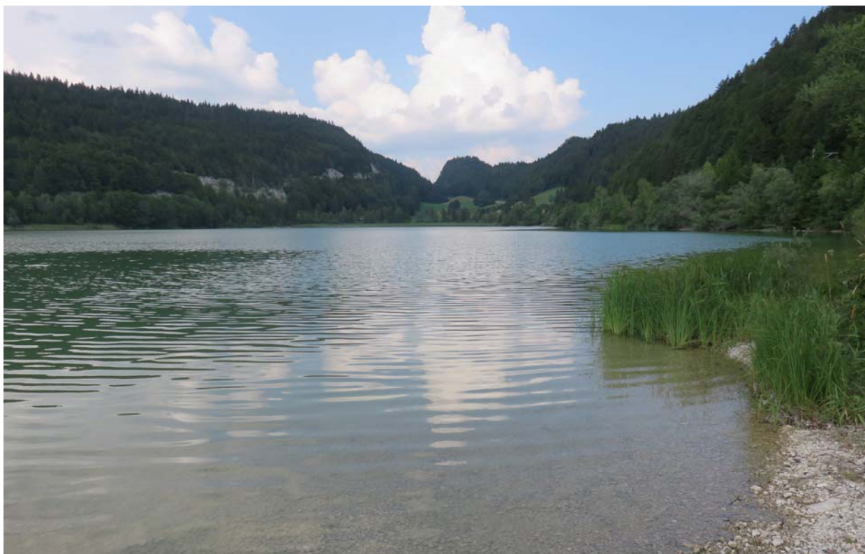
Un coin si paisible. Au fond, le Crêt Mal-Rond.