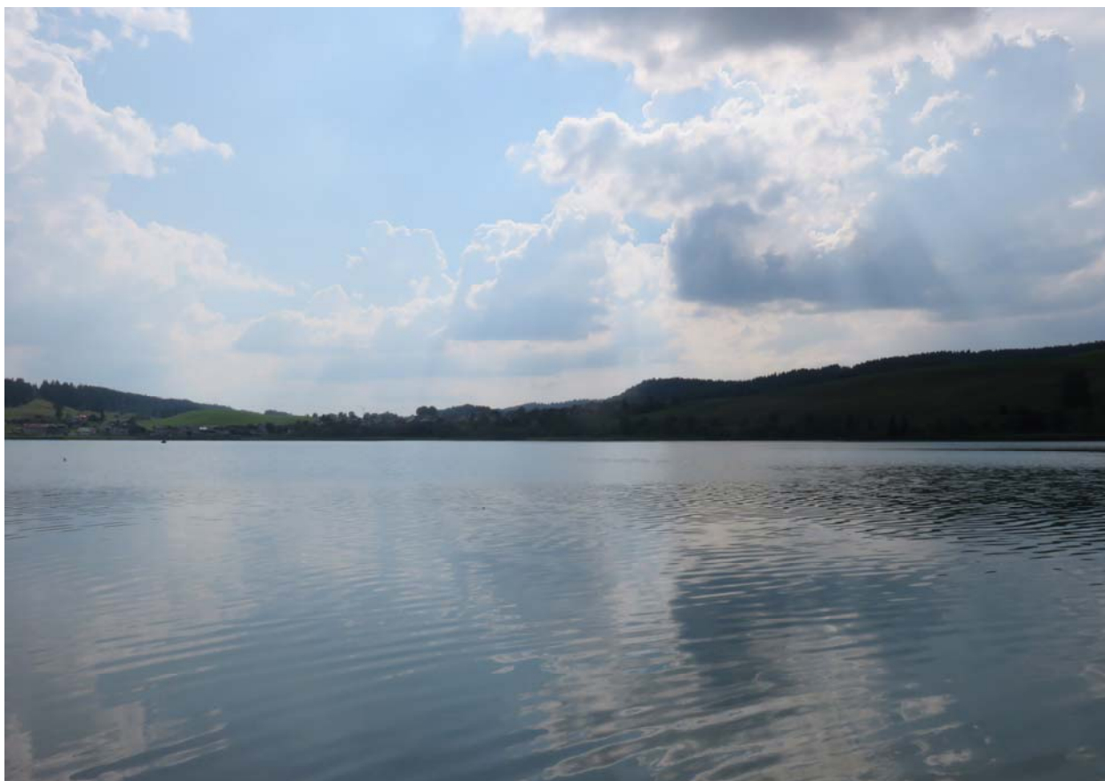
Là-bas est son village. Malheureusement le lac retrouve vu d ici ses couleurs ordinaires.