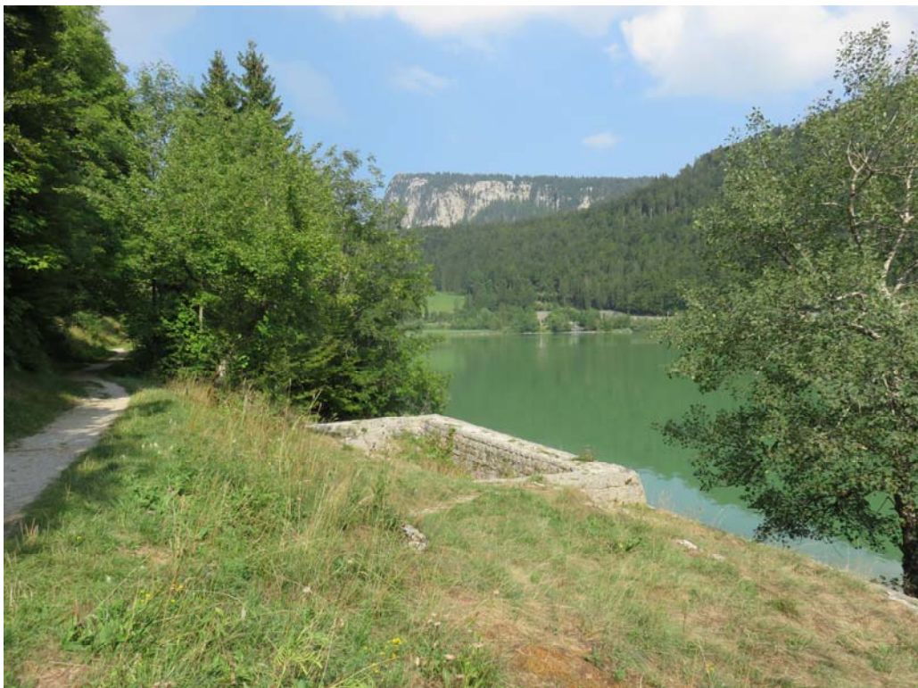
Du côté de l'entonnoir aux Italiens.

On l'a retrouvé un autre jour, tout en faisant son tour pour la 500 e fois peut-être !