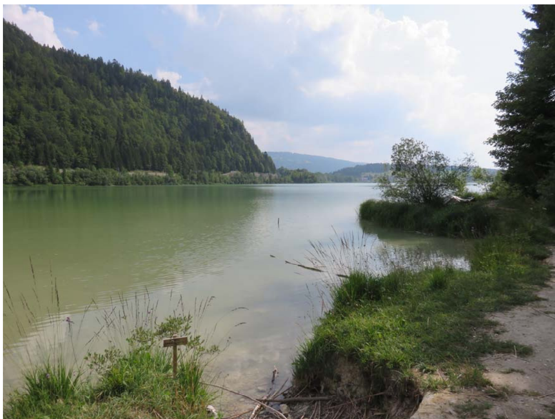
Il est un endroit à La Tornaz où les peintres ont posé leur chevalet.